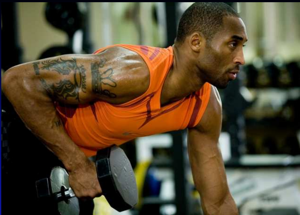
高比·拜仁 Kobe Bryant